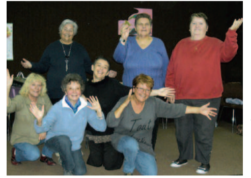
La maison de Pierre

Ne manquez pas ce rendez-vous théâtre sur Marennes à La Maison des Associations, située rue Georges Clemenceau, le lundi après-midi de 14h30 à 16h30, tous les quinze jours. Le calendrier des séances est affiché sur place.