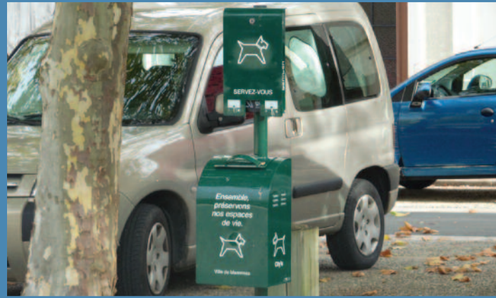
Un des distributeurs de sacs à déjections canines

Mettre en place un ramassage spécialisé, c'est un moyen d'intervention à posteriori qui ne dispense pas les propriétaires d'animaux de respecter le domaine public.