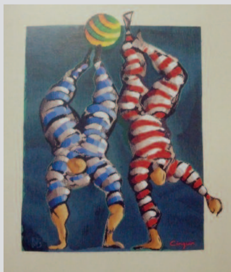
«Les Saltimbanques», tapisserie de Jacques Cinquin

Après avoir accueilli, au cours des dernières semaines trois expositions différentes, la salle d'exposition municipale accueillera au cours des prochains mois, quatre nouvelles expositions aussi variées que talentueuses.