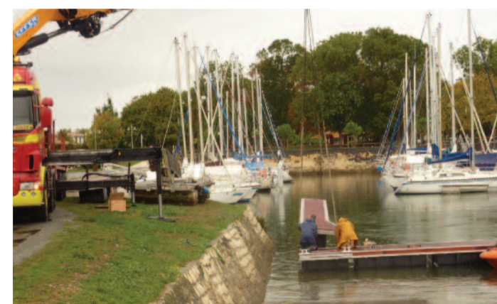
Montage du nouveau ponton et de ses catways.

D'autres investissements seront réalisés par la municipalité afin d'améliorer le port de plaisance. Les travaux d'aménagement de l'aire de grutage et de carénage font actuellement l'objet d'une étude par le cabinet FR Environnement.