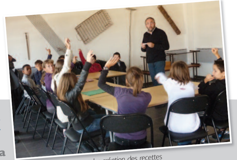
La création des recettes