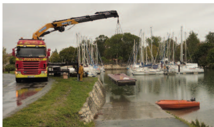
Récupération de l'ancien ponton abîmé.

Le 4 octobre dernier, la commune a dû faire effectuer quelques travaux au port de plaisance de Marennes suite aux dégâts subis lors du passage de Xynthia le 28 février dernier.