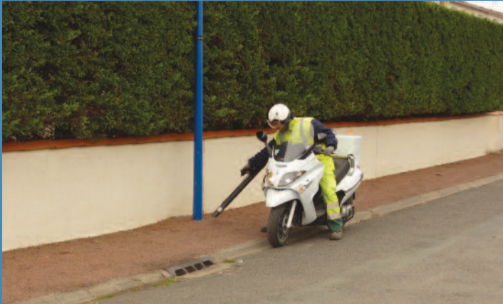
La nouvelle moto à déjections canines

Actuellement, l'agent chargé de cette mission rôde les circuits pour, à terme, effectuer des passages réguliers dans l'ensemble de la commune. Cette mise en œuvre devrait participer à l'amélioration du cadre de vie des Marennais.