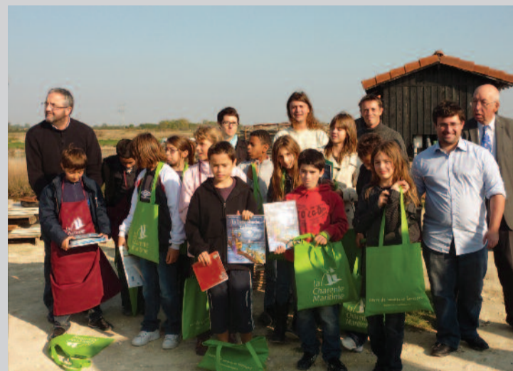
Le groupe de collégiens à la sortie de la cité de l'huître

- La matinée fut dédiée à la théorie avec une intervention des membres de l'IRQUA au collège. Les élèves ont ainsi pu découvrir le fonctionnement de la démarche qualité, le décodage d'un code barre, la qualité d'un label, ... Ils ont également découvert un large éventail de produits régionaux et ont appris à différencier, par le goût, la qualité de produits identiques.