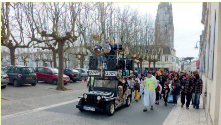
Défilé rue François Fresneau

Le 16 février dernier, le Comité des fêtes et la ville de Marennes ont organisé un après-midi «Mardi gras et carnaval» place des halles et au Centre d'Animation et de Loisirs. Tout a commencé à 15h par un défilé des enfants (et de leurs parents) autour de la place des Halles, via la rue Le Terme. Ce défilé, en musique, a permis à tous de bien s'amuser sur des rythmes entraînants autour, notamment, de Tigrou et de Winny l'ourson, venus animer ce défilé. Le cortège de princesses, de fées ou de justiciers masqués a ensuite pris la direction du Centre d'Animation et de Loisirs où tout le monde a pu profiter d'un bon goûter et d'un peu de chaleur pour achever cette manifestation en beauté et en musique !