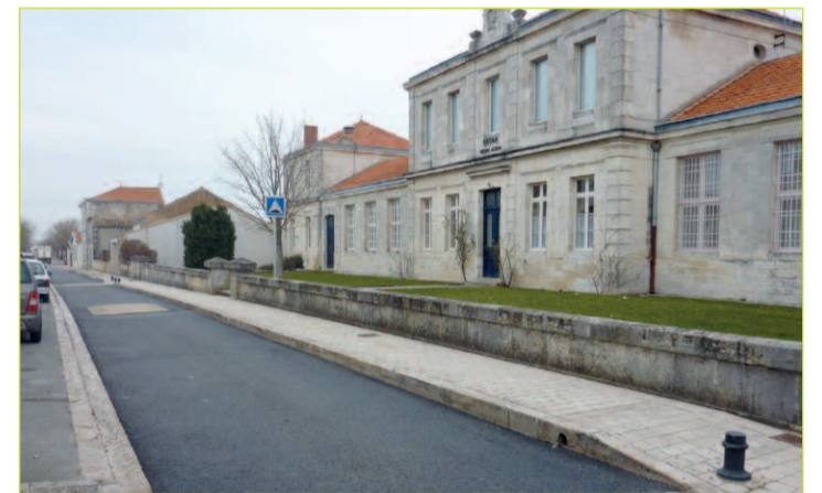
Les travaux finis devant l'école

Aussi, parents et enfants pourront-ils désormais traverser la rue Georges Clemenceau sans craindre l'arrivée trop rapide des conducteurs irrespectueux des piétons.