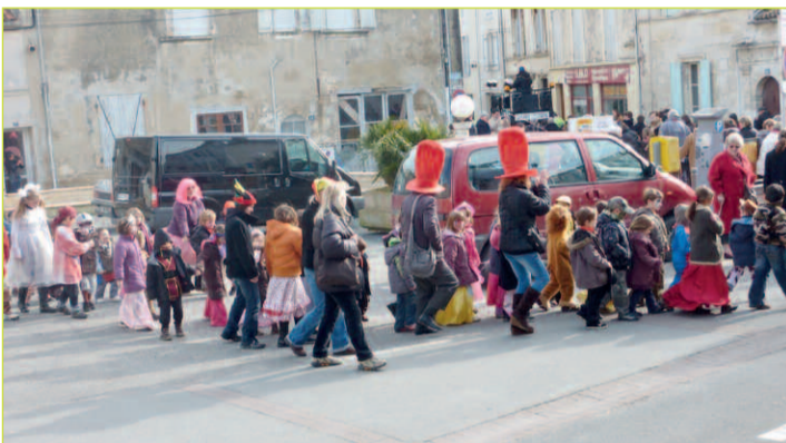
Défilé au départ de la place des Halles

Le 16 février dernier, le Comité des fêtes et la ville de Marennes ont organisé un après-midi «Mardi gras et carnaval» place des halles et au Centre d'Animation et de Loisirs. Tout a commencé à 15h par un défilé des enfants (et de leurs parents) autour de la place des Halles, via la rue Le Terme. Ce défilé, en musique, a permis à tous de bien s'amuser sur des rythmes entraînants autour, notamment, de Tigrou et de Winny l'ourson, venus animer ce défilé. Le cortège de princesses, de fées ou de justiciers masqués a ensuite pris la direction du Centre d'Animation et de Loisirs où tout le monde a pu profiter d'un bon goûter et d'un peu de chaleur pour achever cette manifestation en beauté et en musique !