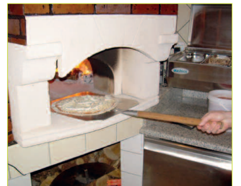
Le four à bois de la nouvelle pizzeria

Avant de partir : vous en prendrez bien une petite dernière pour la route ? Pour les gourmands : des pizzas-dessert... au chocolat !!!... à consommer SANS modération !!!