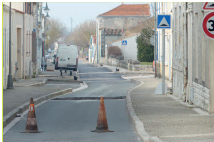
Travaux en cours rue Clemenceau

Au cours de la semaine du 8 février se sont déroulés des travaux de pose de deux ralentisseurs et de réfection de la chaussée de la rue Georges Clemenceau. Cet aménagement constituait l'une des priorités que la commune s'était fixée en matière de voirie et de sécurité : outre la réfection de la chaussée qui était en mauvais état et qui va apporter un plus grand confort aux automobilistes ainsi qu'aux cyclistes, la pose de ralentisseurs va permettre de réduire la vitesse de circulation aux abords de l'école élémentaire Henri Aubin. Ces ralentisseurs s'accompagnent de la