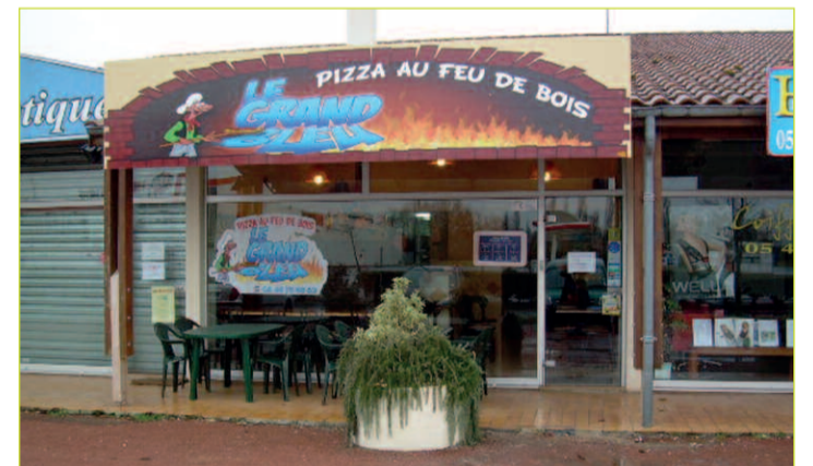
La nouvelle pizzeria dans la zone artisanale

Le dimanche 21 février 2010 à 17 heures, s'est inaugurée la nouvelle pizzeria « Le Grand Bleu » à Marennes (Z.A. Les Grossines - Face à Intermarché).