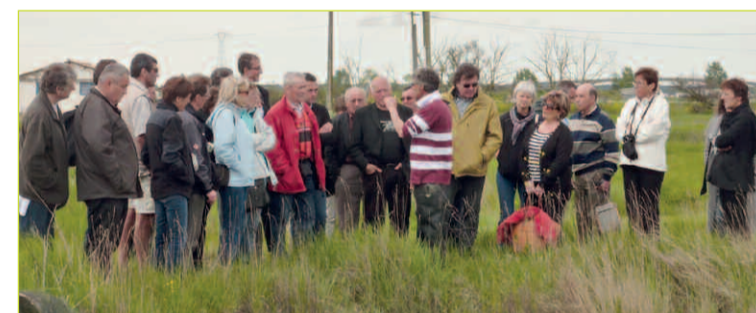
Visite d'une exploitation ostréicole

Cette rencontre qui a été placée sous le signe de la fraternité, pourrait donner envie à tous ceux qui le désirent, d'y participer, et ce, dès l'année prochaine, en prenant part au voyage à Corcelles-en-Beujolais, déjà inscrit au programme.