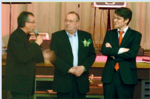
Messieurs les maires de Corcelles-en-Beujolais, Aydat et Marennes