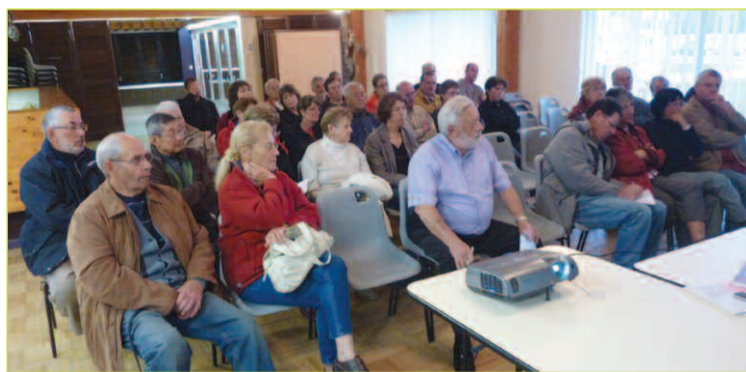
Les habitants de Nodes/La Chainade étaient au rendez-vous

Le 22 avril dernier a eu lieu la réunion du quartier de Nodes/La Chainade, organisée par la municipalité, première d'une série de 10 réunions qui se tiendront dans tous les quartiers de la commune.