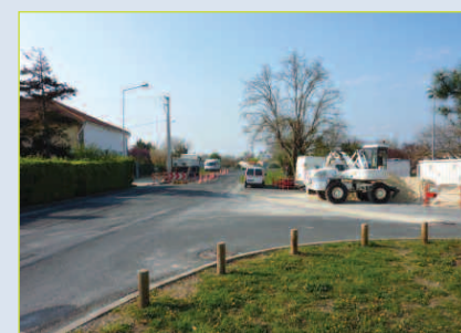
Les travaux du nouveau giratoire rue Palacin.

Philippe Moinet, adjoint à l'urbanisme, fait le point sur les travaux du mois :