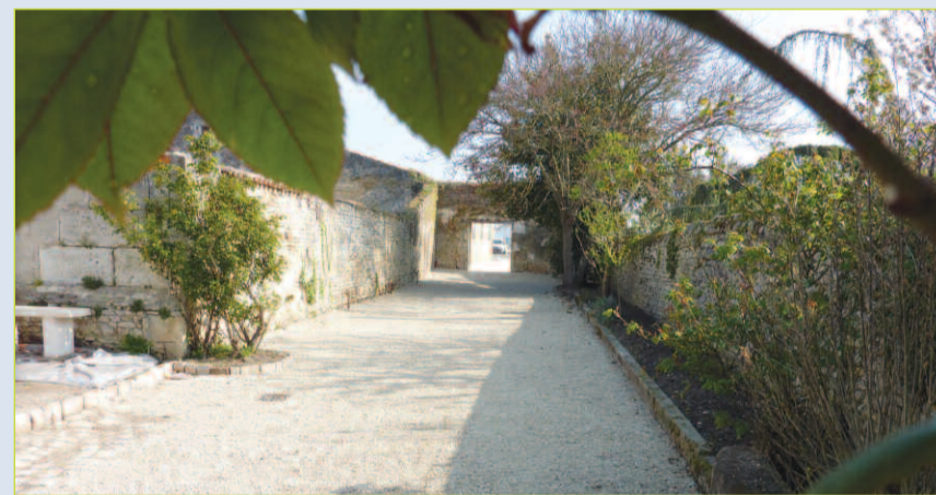
Les anciens ateliers municipaux réhabilités.

Un mois de mai encore bien chargé en ce qui concerne la voirie, mais nécessaire au regard des objectifs que la mairie s'est fixés, maintenus à un niveau élevé afin de continuer à améliorer le cadre de vie de notre commune.