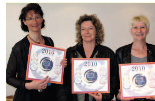
À Marennes, trois commerçantes récompensées