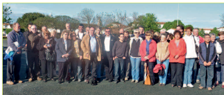
Le groupe devant le Centre d'Animations et de Loisirs

La commune de Marennes, a reçu, durant le week-end du 1 er mai dernier, une délégation des communes de Corcelles-en-Beujolais (69) et d'Aydat (63). L'an passé, cette dernière a reçu des membres du Club Détente et Loisirs.