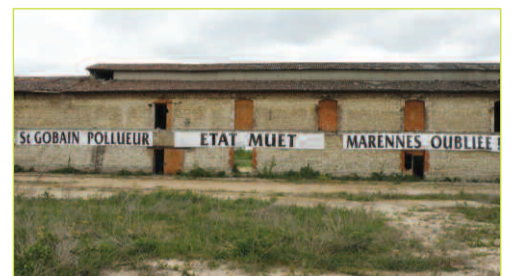
« Saint-Gobain pollueur, Etat muet, Marennnes oubliée ! »

Coût total de la dépollution : 4 780 000 €.