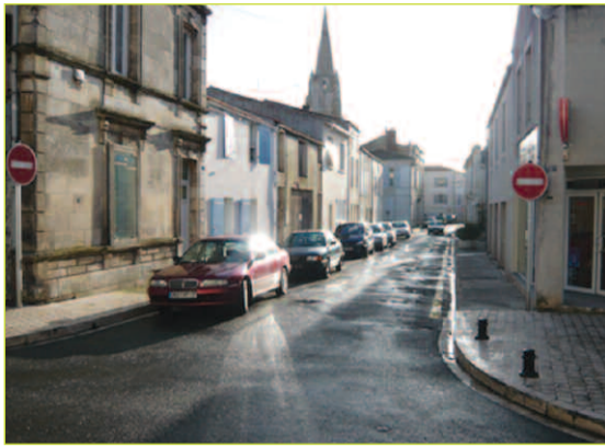
La rue Albert 1 er