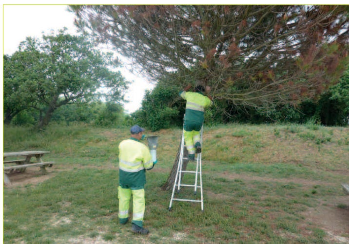
Installation des pièges à phéromones

Aussi, afin d'éviter aux pins situés sur le domaine public comme sur le domaine privé d'être les «victimes» de ces chenilles processionnaires près de 60 pièges à phéromones ont été mis en place, durant la dernière semaine de mai, sur le domaine public (dans le bois de Marennes Plage) afin d'attirer les papillons et de les enfermer dans ces pièges. Si ce traitement démontre une efficacité totale, d'autres pièges à phéromones pourraient être mis en place par la suite. Les particuliers peuvent se procurer ces pièges auprès de la FDGDON. Cette solution, plus écologique, plus responsable et moins dangereuse pour le milieu ostréicole sera donc testée cette année. Cela devrait réduire les dégâts que les chenilles processionnaires peuvent occasionner sur la flore littorale.