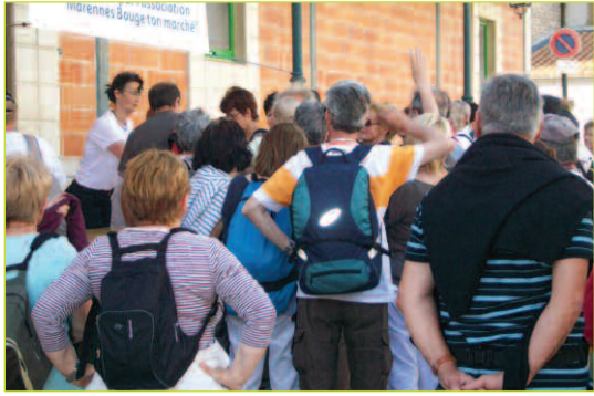
Départ de la randonnée