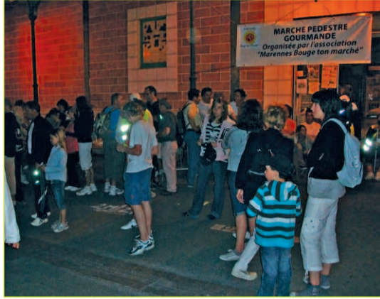
Affluence importante pour cette première randonnée.