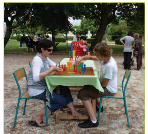
Les Marennais à la découverte des jeux

Malgré un temps maussade, les passionnés de jeu s'étaient donné rendez-vous à la Fête du Jeu annuelle organisée par l'association Lud'Oléron. Le jardin public présente un cadre idéal pour ce type de manifestation : espace et calme sous les frondaisons des marronniers. Outre les jeux traditionnels, la ludothèque a mis à disposition du public des jeux de patience, de casse-tête, d'adresse ainsi que des jeux festifs et d'ambiance. Une nouveauté a rassemblé des joueurs de tous âges : le Weykick, jeu en bois très manuel. Rendez-vous est donné l'an prochain, à la même date, à cette fête mondiale du jeu.