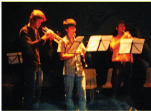
Des élèves de l'école de musique en concert