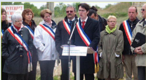
Le maire et ses adjoints lors de la conférence de presse du 5 mai 2010.