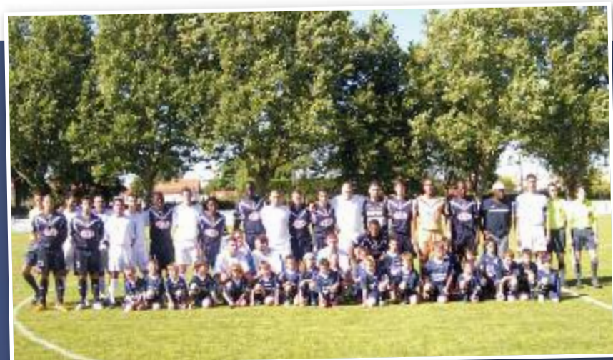
Les Girondins de Bordeaux, les joueurs de Fontenay et les jeunes Marennais lors du match en 2009