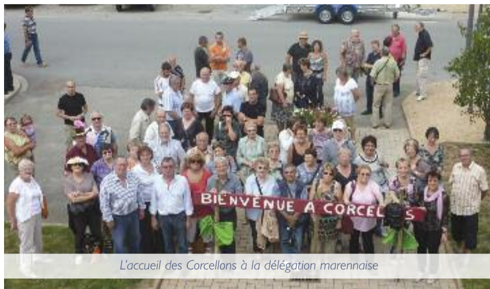
L'accueil des Corcellons à la délégation marennaise