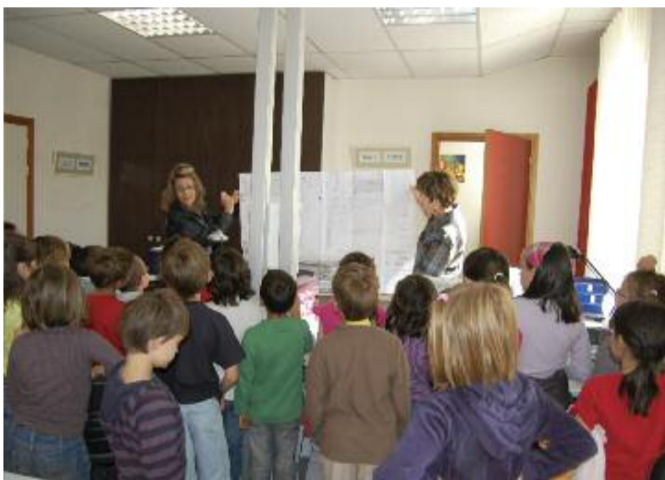
Les élèves en visite au service urbanisme/cadastre de la mairie découvrant les plans du futur centre équestre